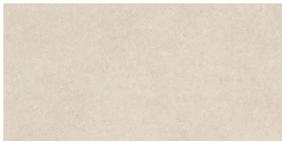
Nantes 6120 Sand