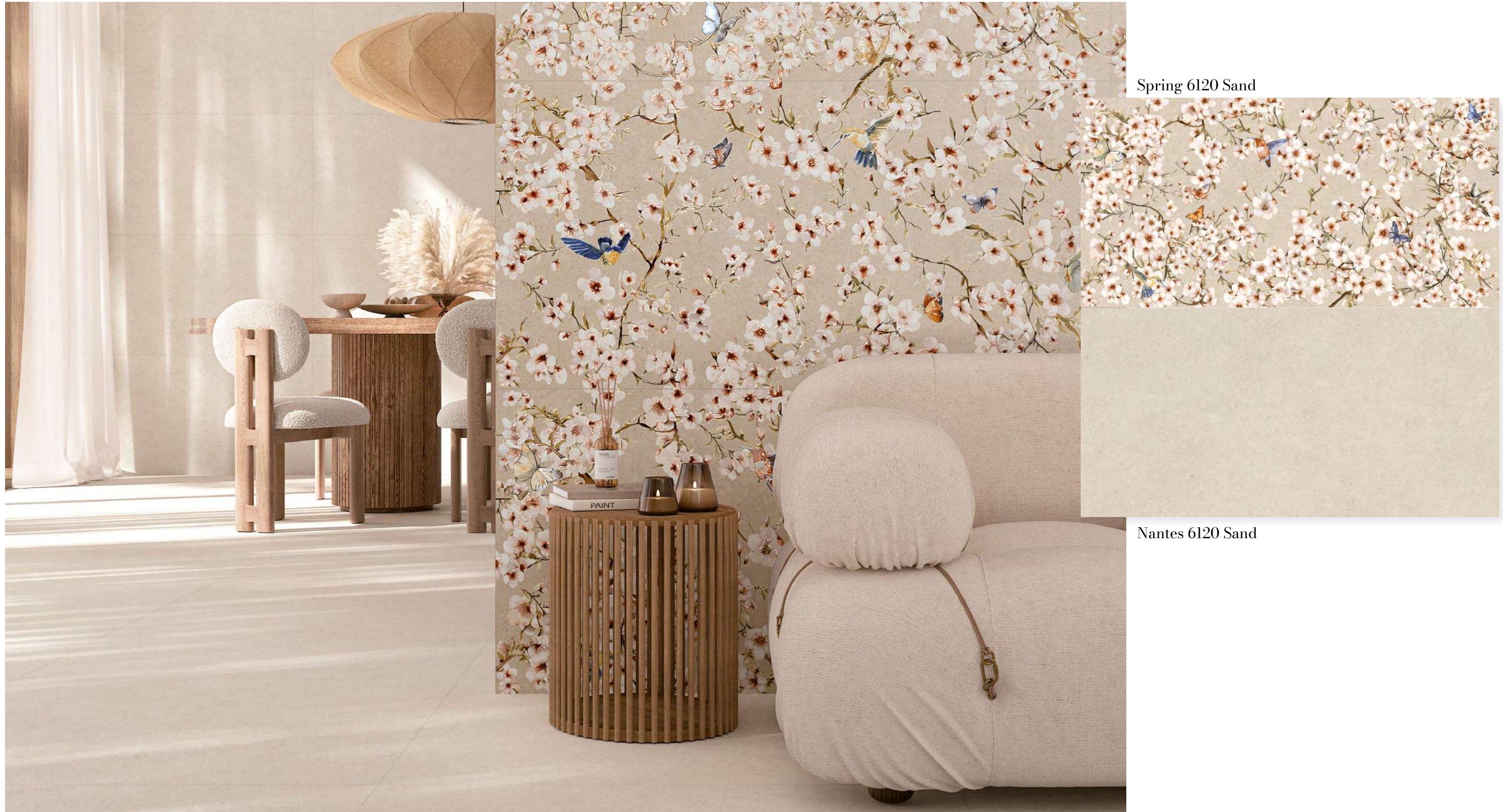
Spring 6120 Sand