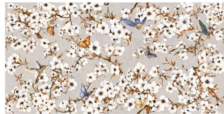
Spring 6120 Grey NB830 / 203.470 60 x 120 cm