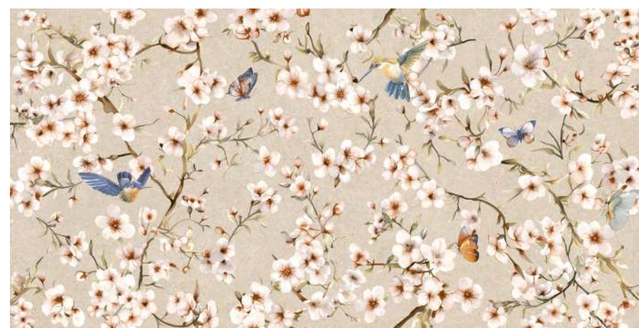
Spring 6120 Sand NB830 / 203.471 60 x 120 cm