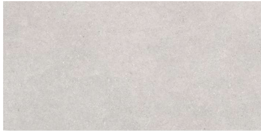
Nantes 6120 Grey