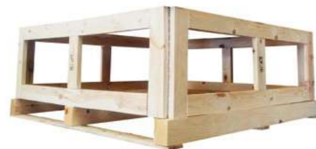
Pallet / palet