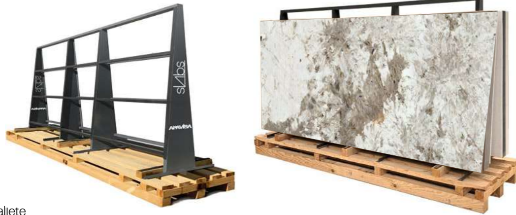
A-frame / Caballete