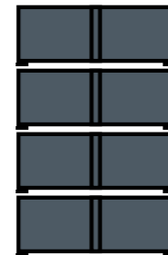
4 levels / 4 niveles