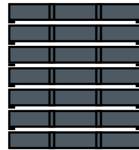
7 levels / 7 niveles