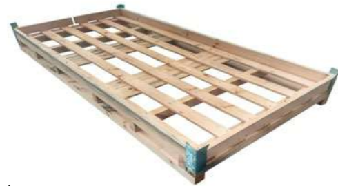
Crate / caja madera