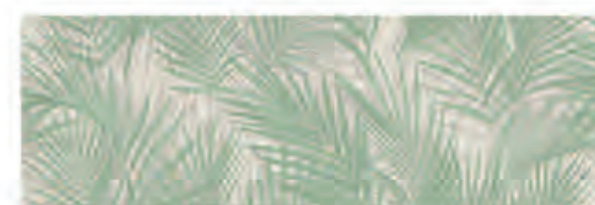
INSERTO KENZIE CALCE