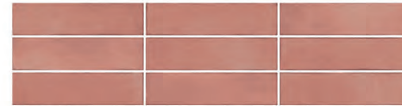
0697009 CORALLO 7x28