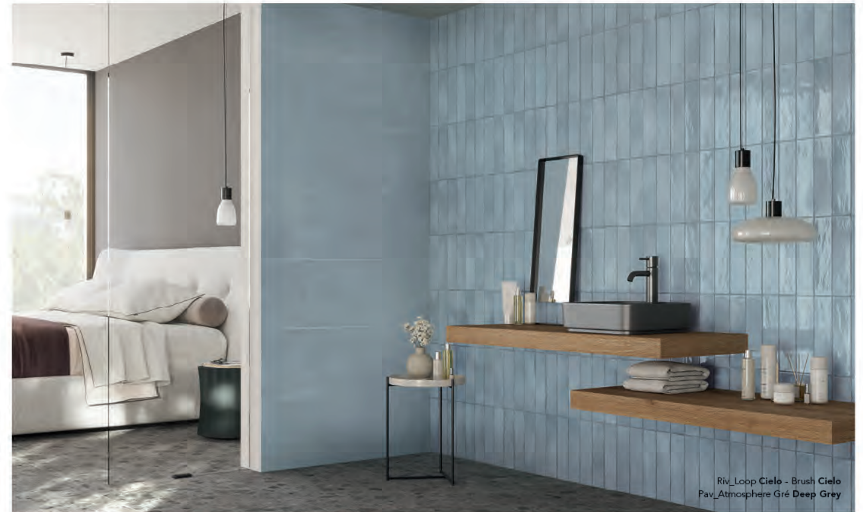
Riv_Loop Cielo - Brush Cielo Pav_Atmosphere Gré Deep Grey

Die perfekte Abstimmung der Farbtöne ermöglicht originelle und lebendige Kombinationen, die mit der glänzenden und strahlenden Oberfläche der "Bausteine" von Loop und dem halbgänzenden Harzeffekt von Brush spielen. Ein Wechselspiel von Effekten, Farben und Formaten, das nicht nur ein starkes kreatives Potenzial, sondern auch einen raffinierten Stil im Einklang mit den aktuellen Interior Design Trends garantiert.