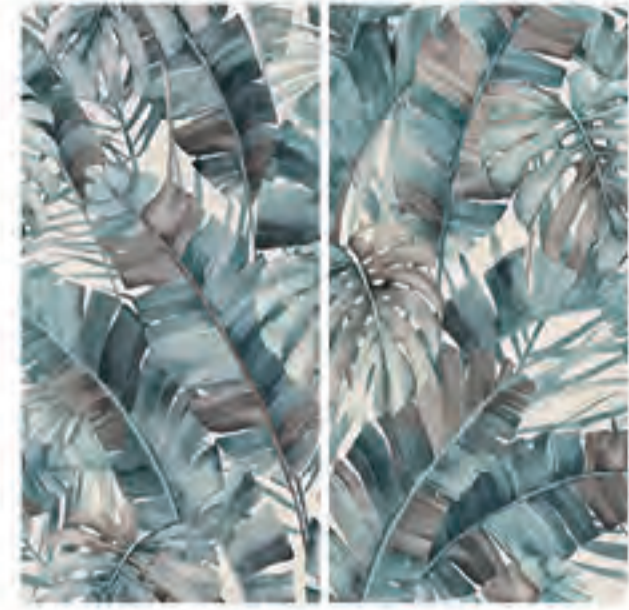
0451031 RAIN FOREST 120x120 Composizione: 2 pz. A+B - 60x120