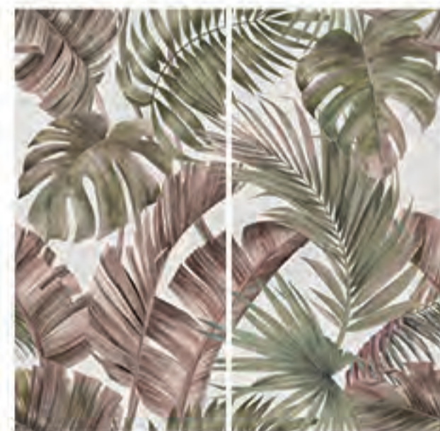
0451038 FANCY WALL 120x120 Composizione: 2 pz. A+B - 60x120