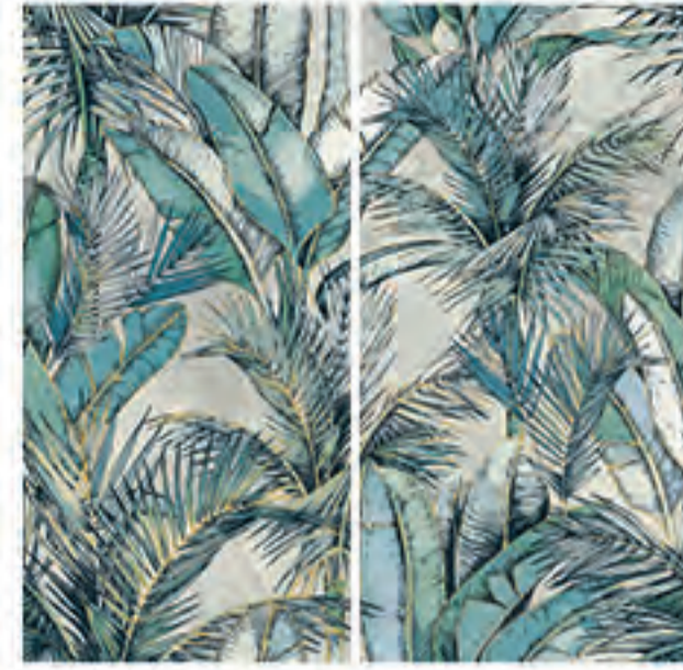
0451015 EDEN 120x120 Composizione: 2 pz. A+B - 60x120