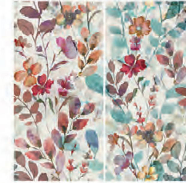
0451064 WILDFLOWERS 120x120 Composizione: 2 pz. A+B - 60x120