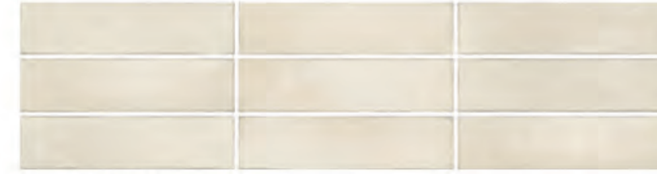
0697006 CREMA 7x28