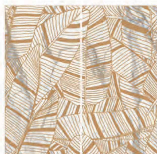
0451032 INCANTO 120x120 Composizione: 2 pz. A+B - 60x120