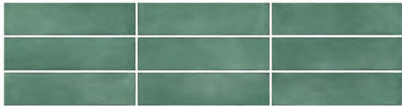
0697005 BOSCO 7x28