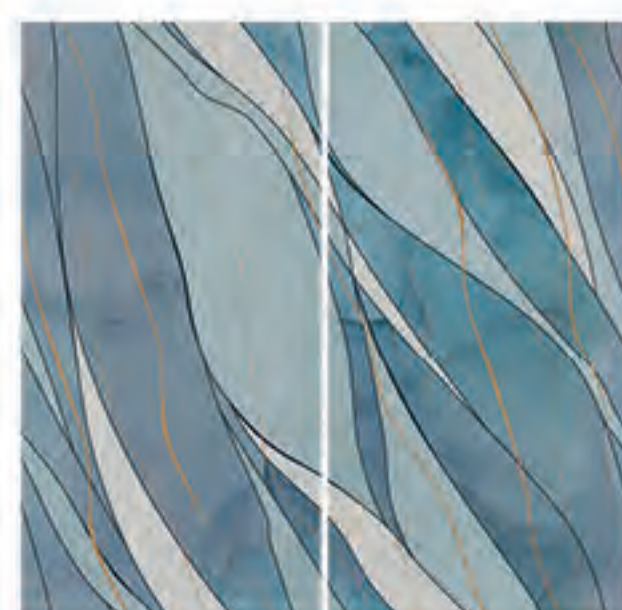
0451041 ICELAND 120x120 Composizione: 2 pz. A+B - 60x120