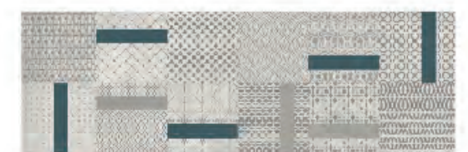
INSERTO SHAPE TITANIO