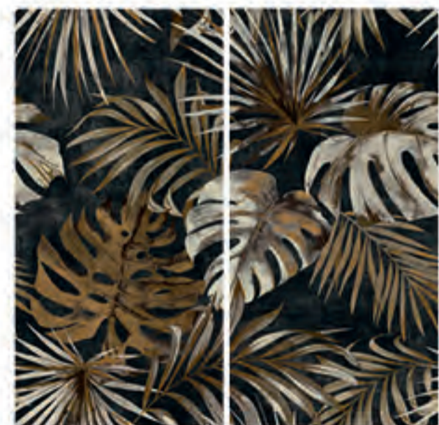
0451012 GOLDEN LEAVES 120x120 Composizione: 2 pz. A+B - 60x120