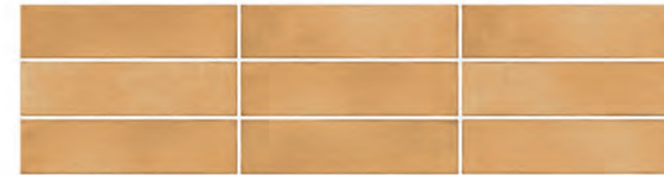
0697010 CAMEL 7x28