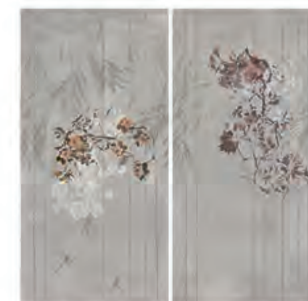
0451002 CHARME 120x120 Composizione: 2 pz. A+B - 60x120