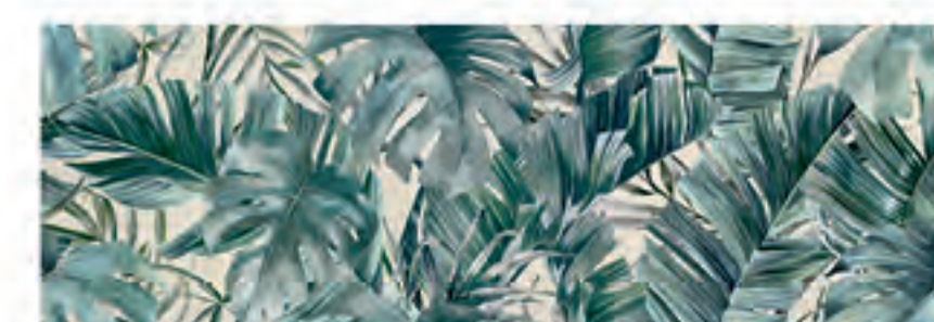
INSERTO UNIVERSE CALCE