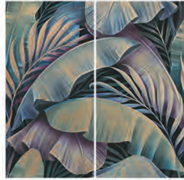
0451037 TEMPTATION 120x120 Composizione: 2 pz. A+B - 60x120