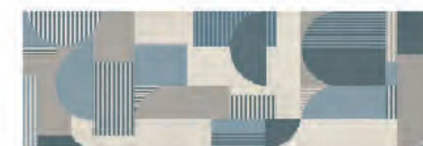
INSERTO PRISMA CALCE