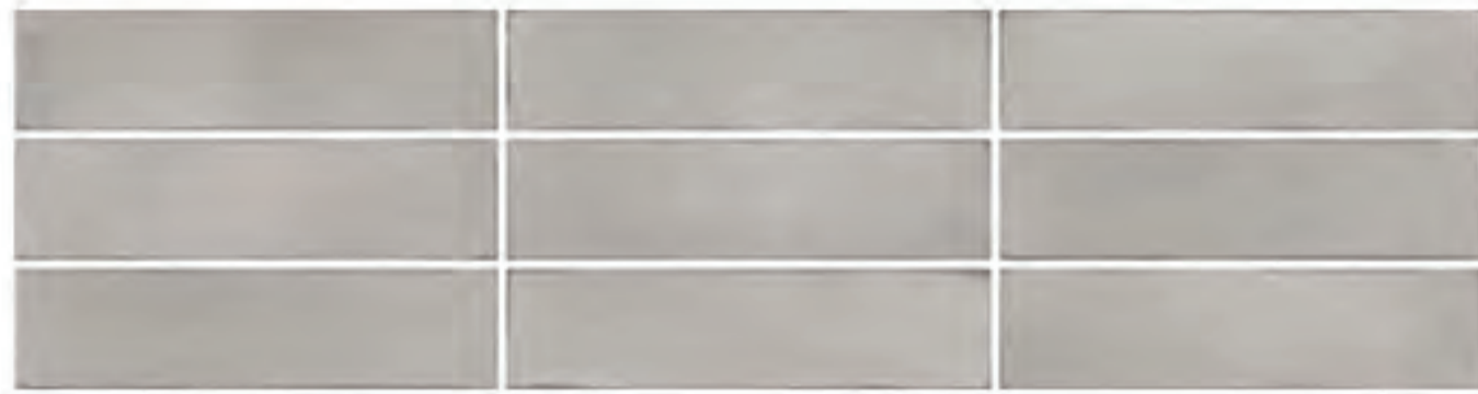
0697002 TITANIO 7x28