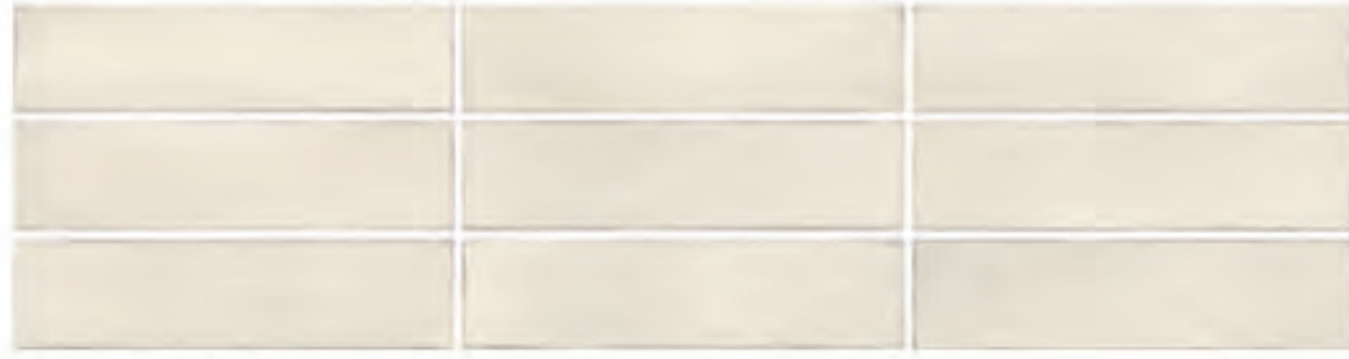
0697001 CALCE 7x28