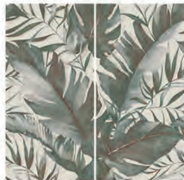
0451001 SAVAGE 120x120 Composizione: 2 pz. A+B - 60x120