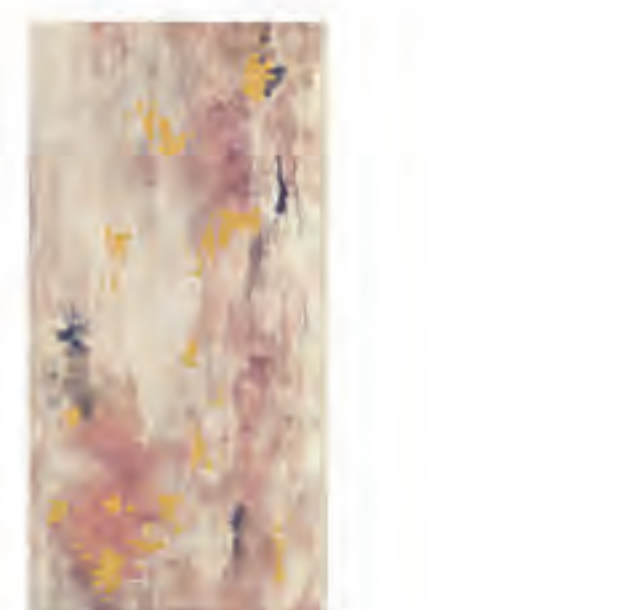
0451005 PAINT 60x120