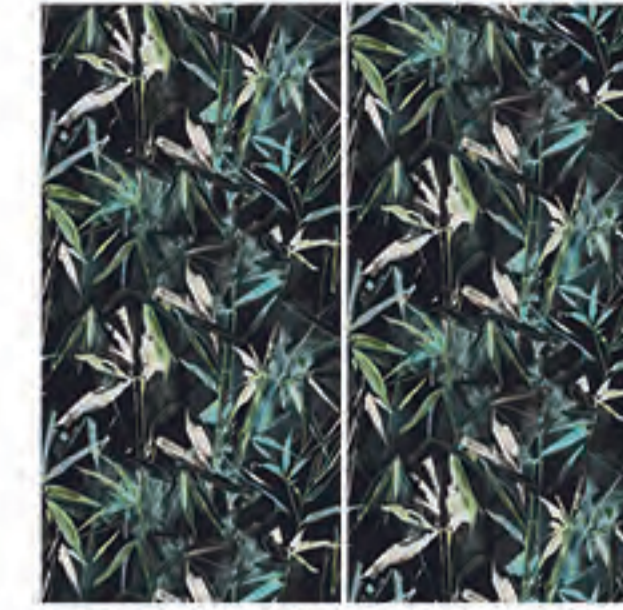
0451040 BAMBU SKETCH 120x120 Composizione: 2 pz. A+B - 60x120