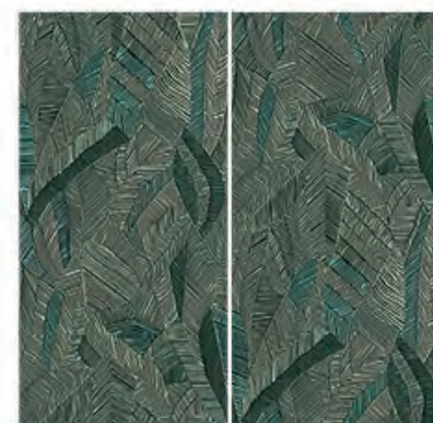
0451034 WILD ATELIER 120x120 Composizione: 2 pz. A+B - 60x120