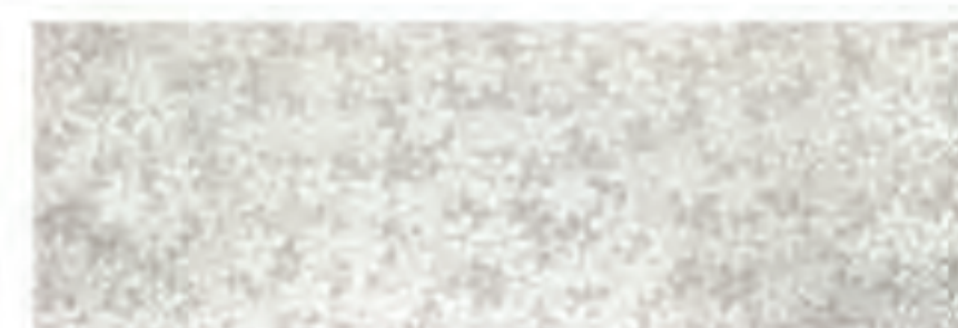
INSERTO PETALI CALCE