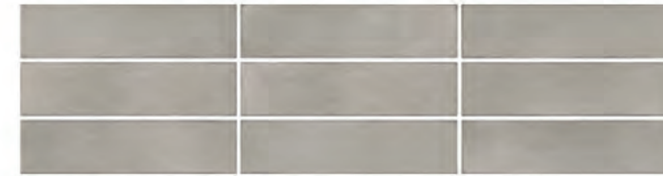
0697007 TERRA 7x28