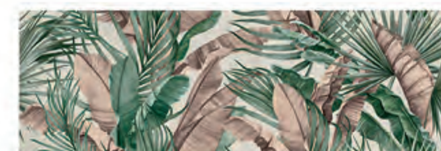
INSERTO GIPSY CALCE