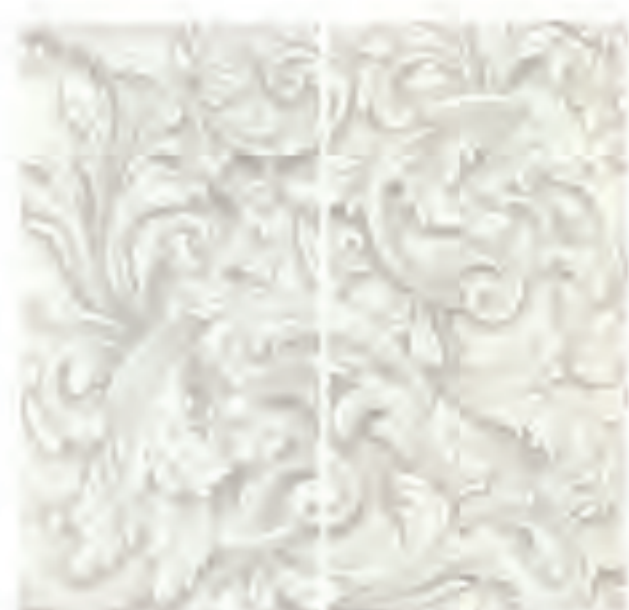
0451063 VENUS 120x120 Composizione: 2 pz. A+B - 60x120