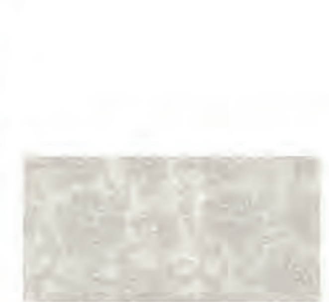
0451004 ROMANCE 60x120