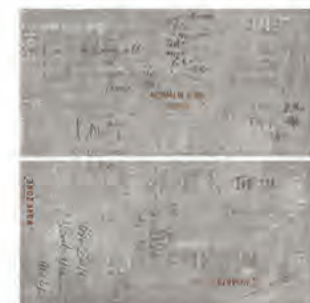
0451013 GRAFFITI 120x120 Composizione: 2 pz. A+B - 60x120