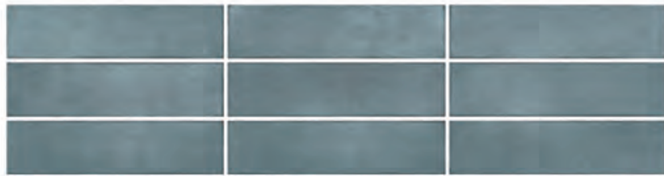
0697004 ZAFFIRO 7x28