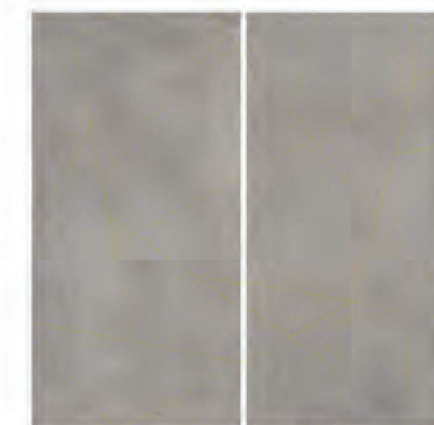
0451017 GOLD LINE CEMENTO 120x120 Composizione: 2 pz. A+B - 60x120