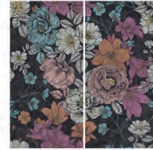
0451042 WONDERLAND 120x120 Composizione: 2 pz. A+B - 60x120