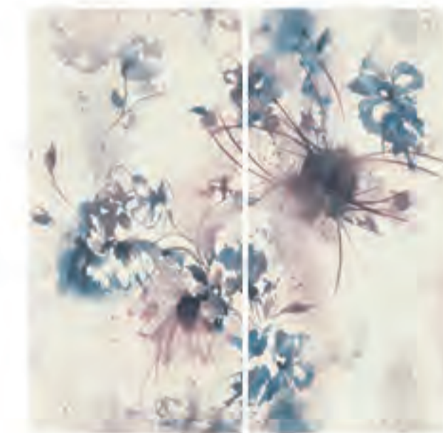
0451016 MEMORIE 120x120 Composizione: 2 pz. A+B - 60x120