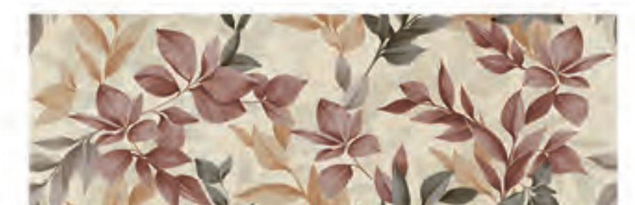
INSERTO FALL CREMA