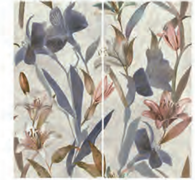
0451036 LILIUM 120x120 Composizione: 2 pz. A+B - 60x120