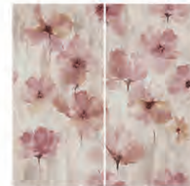
0451003 POETICA 120x120 Composizione: 2 pz. A+B - 60x120