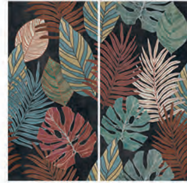
0451011 POP GARDEN 120x120 Composizione: 2 pz. A+B - 60x120