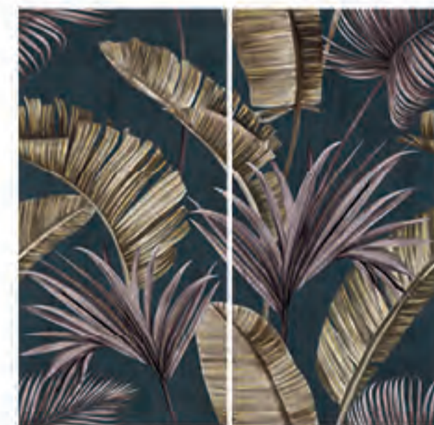
0451033 PURPLE CHIC 120x120 Composizione: 2 pz. A+B - 60x120