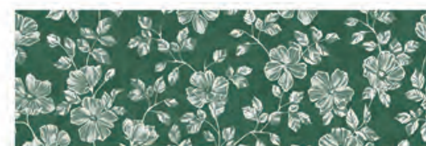
INSERTO BLOSSOM BOSCO