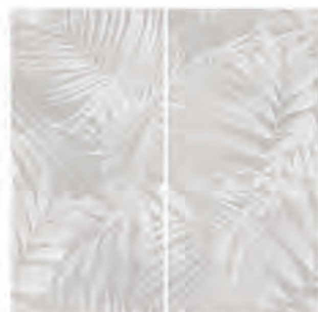
0451035 COTTON GARDEN 120x120 Composizione: 2 pz. A+B - 60x120