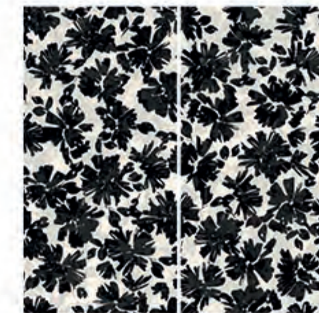
0451014 BLACK FLOWERS 120x120 Composizione: 2 pz. A+B - 60x120