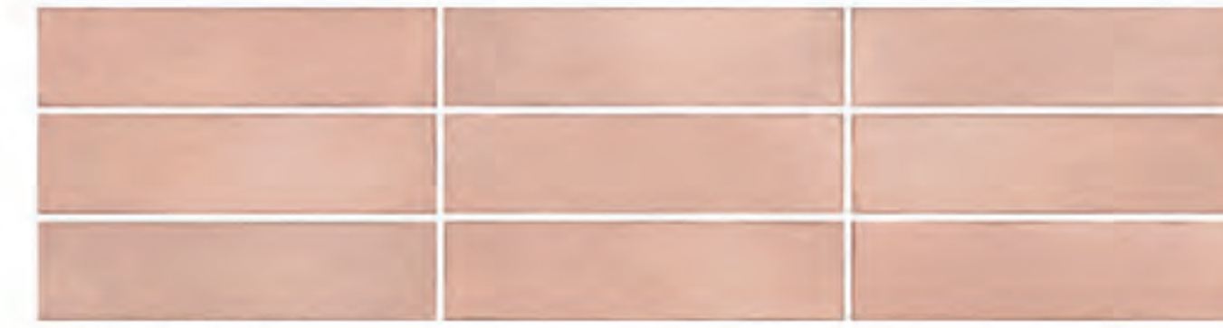
0697008 CIPRIA 7x28