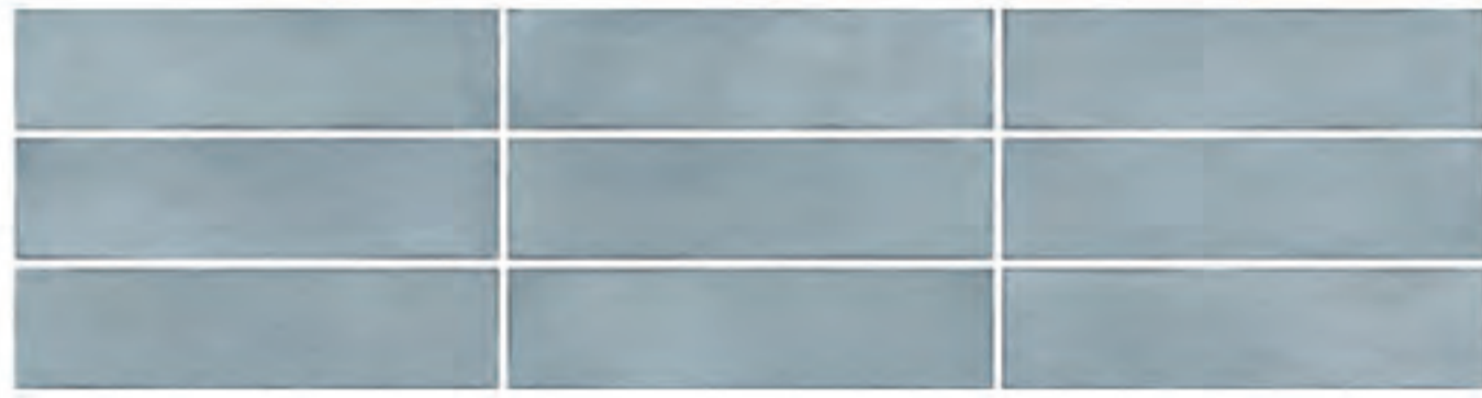
0697003 CIELO 7x28