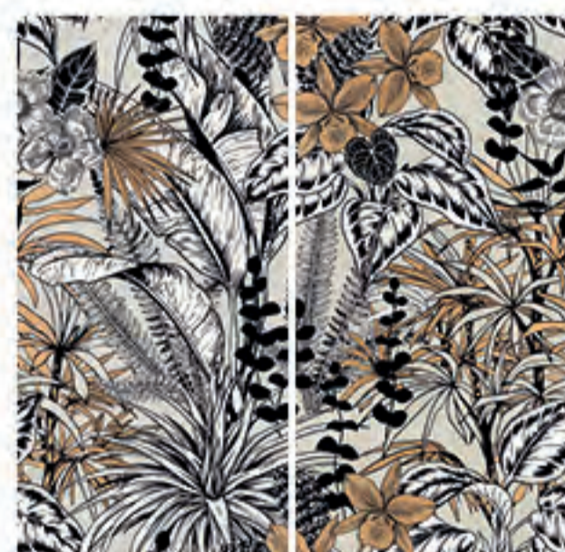
0451039 MACROPHILLA 120x120 Composizione: 2 pz. A+B - 60x120