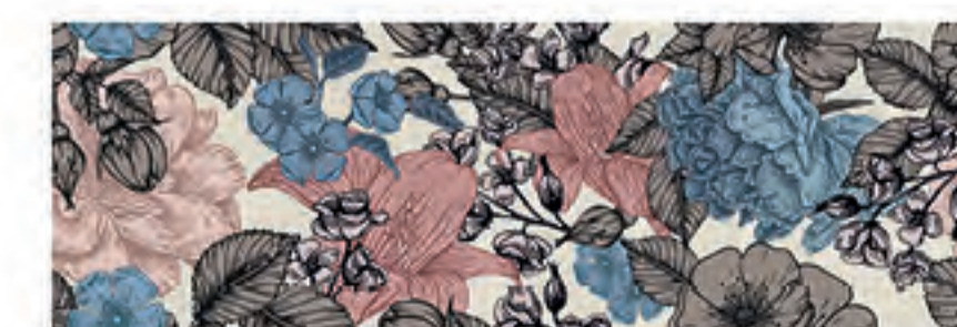
INSERTO BOUQUET CALCE